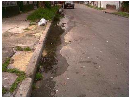
Foto N°2. Se ha evidenciado en este tramo que las obras presentan un leve aposamiento de agua, sin embargo se evidencia que el estancamiento de la misma está dado por la falta de limpieza y mantenimiento de los sumideros.