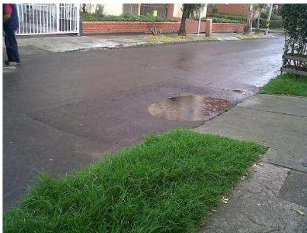
Foto N° 9. Presenta hundimiento y aposamiento de agua en zona de reparcho parcial por estabilidad de obra.