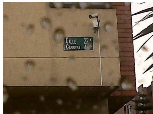
Foto N° 8. Calle 22ª con Carrera 44 C, se ha evidenciado que corresponde a la dirección nueva Calle 22 Bis entre Carr 44ª y 44B..