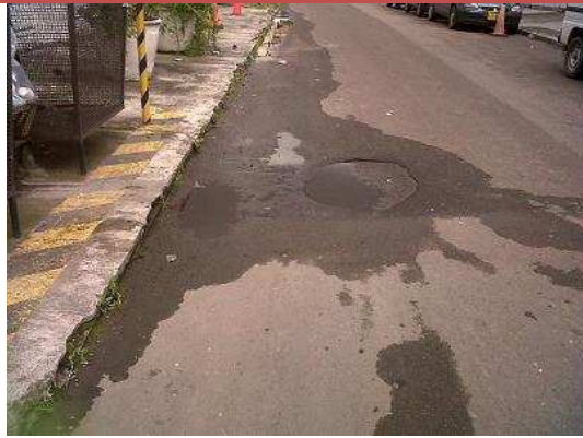
Foto N° 5. Carrera 36 a Entre Calle 25 y 25° Se Evidencia que entramo de reparcho se ha generado desgaste por aposamiento de y segregación de asfalto.